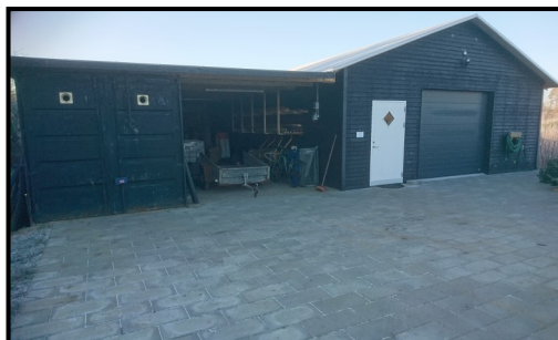
Det nybyggede værksted på Søby Brunkulsmuseum

frivilliges indsats. Velux Fondens pulje til Aktive Ældre har af den grund bevilget 100.000 kr, Norlys 75.000 kr, Helle Mau Jensens Fond 15.000 kr og Herning Kommune 5.000 kr.