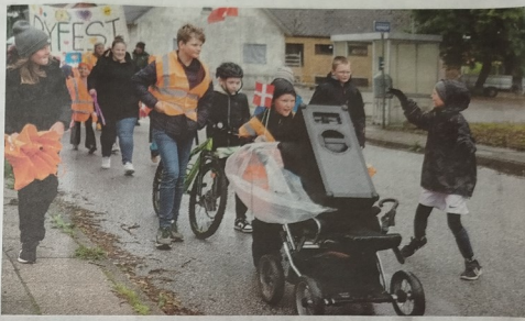
◻ Det kniber emd at finde nok frivillige hænder i Kølkær. Efter et opråb fra byens idrætsforening ser det ud til, at Kølkær får sin byfest også i 2025.