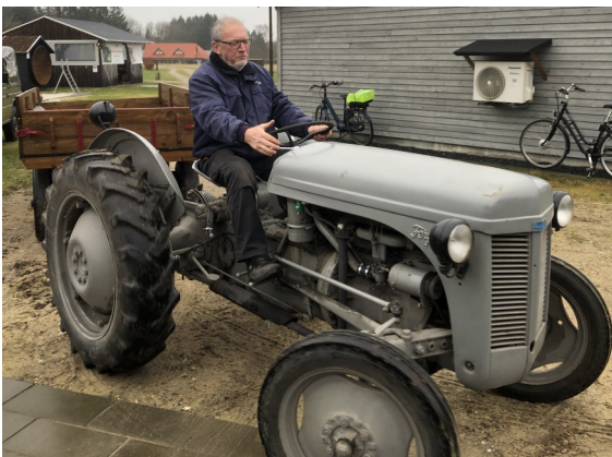
Museums hilsner. Søby Brunkulsmuseum

Følg os på hjemmeside og Facebook. Tilmeld nyhedsbrev via mail til: museum@brunkul.com